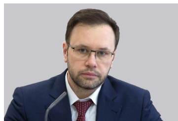
Григорий Лекарев, Заместитель министра труда и социальной защиты Российской Федерации

«Министерство труда и социальной защиты Российской Федерации всецело поддерживает инициативы по развитию отечественного рынка СИЗ, импортозамещению, повышению качества выпускаемой и потребляемой продукции. Важно, что выставка SAPE дает возможность услышать мнения всех участников процесса – от производителей до конечных потребителей».