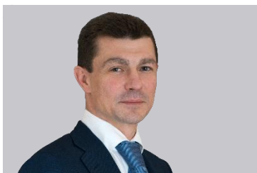
Максим Топилин, Министр труда и социальной защиты Российской Федерации

«Министерство труда и социальной защиты Российской Федерации всецело поддерживает инициативы по развитию отечественного рынка СИЗ, импортозамещению, повышению качества выпускаемой и потребляемой продукции. Важно, что выставка SAPE дает возможность услышать мнения всех участников процесса – от производителей до конечных потребителей».